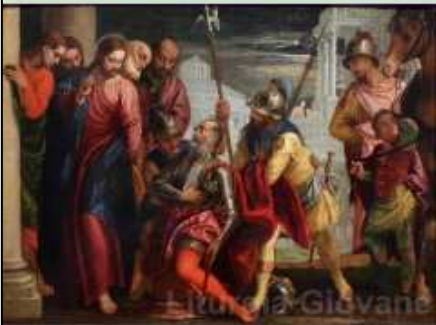
Cristo e il centurione Paolo Veronese